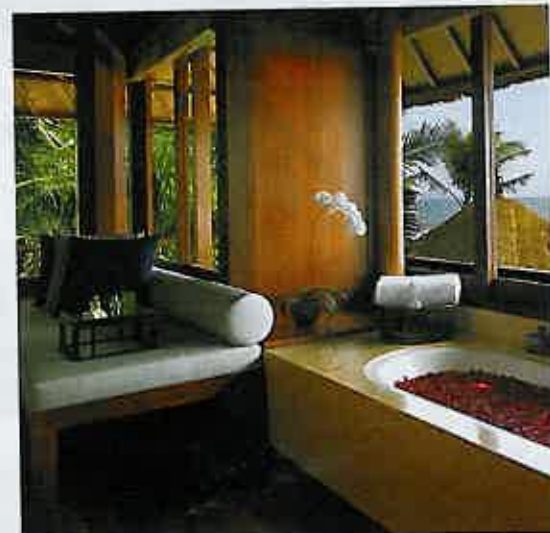
Lo stile del Legian di Bali è simile a quello che sarà il Malkai.

T ALVOLTA QUI IL CIELO SEMBRA quello di Milano d'agosto: bianco, quasi lunare, o comunque di un'altra dimensione, tutt'altro che terrestre. In Oman ci sono momenti in cui le temperature superano i 40 gradi e l'umidità è al 90%. Ci sono i manghi, i banani e le palme da dattero, alcune delle quali sfilano lungo le nuovissime autostrade. Cresce fra il 7 e l'8% l'anno, l'Oman. E gli omaniti paiono amare sinceramente il loro sultano, e il democratico occidentale, che diffida dei propri leader con una certa rassegnata naturalezza, accetta con reticenza l'idea che un popolo intero sia innamorato di un monarca assoluto. Eppure, in Oman, oltre a soffiare un vento di Persia che raccoglie sulla strada effluvi di gelsomino, succede anche questo. «Si dice che l'Oman sia l'ultimo paese da visitare nella Penisola arabica. Andate prima a Dubai, Abu