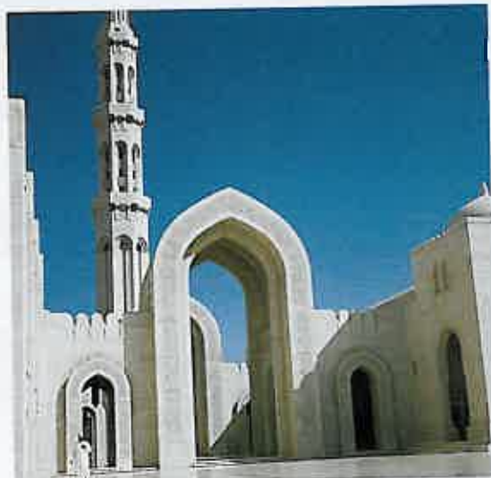
La Grande moschea di Muscat: la terza più grande del mondo.

T ALVOLTA QUI IL CIELO SEMBRA quello di Milano d'agosto: bianco, quasi lunare, o comunque di un'altra dimensione, tutt'altro che terrestre. In Oman ci sono momenti in cui le temperature superano i 40 gradi e l'umidità è al 90%. Ci sono i manghi, i banani e le palme da dattero, alcune delle quali sfilano lungo le nuovissime autostrade. Cresce fra il 7 e l'8% l'anno, l'Oman. E gli omaniti paiono amare sinceramente il loro sultano, e il democratico occidentale, che diffida dei propri leader con una certa rassegnata naturalezza, accetta con reticenza l'idea che un popolo intero sia innamorato di un monarca assoluto. Eppure, in Oman, oltre a soffiare un vento di Persia che raccoglie sulla strada effluvi di gelsomino, succede anche questo. «Si dice che l'Oman sia l'ultimo paese da visitare nella Penisola arabica. Andate prima a Dubai, Abu