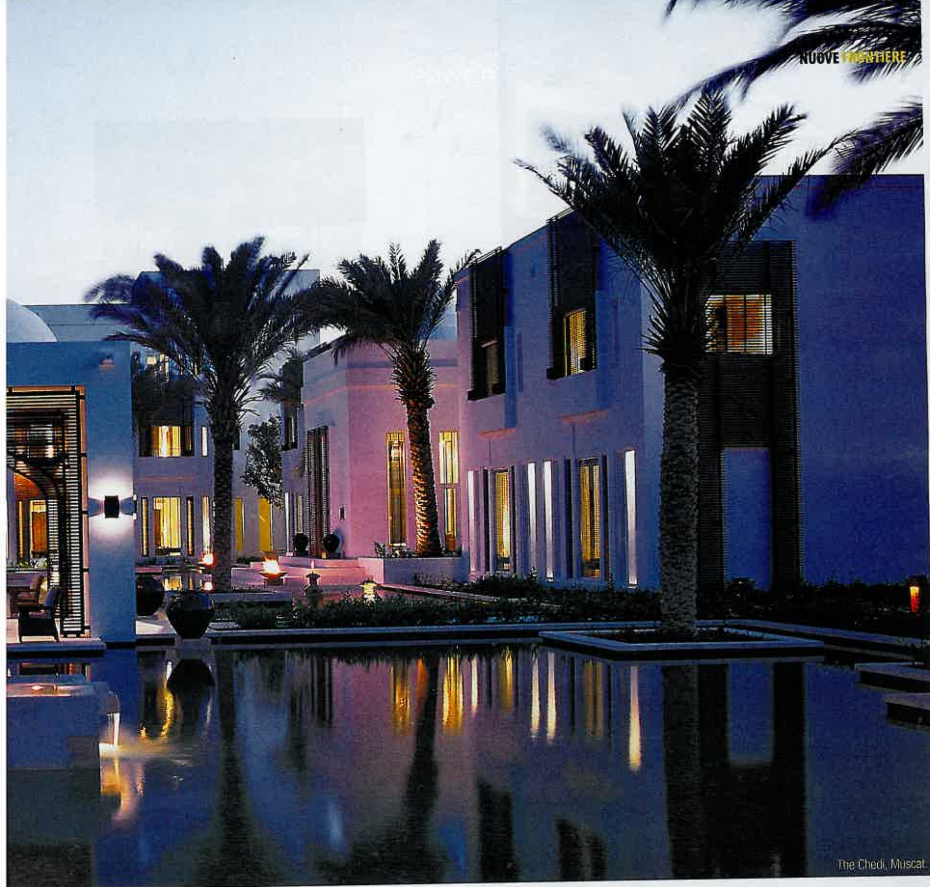
The Chedi, Muscat.