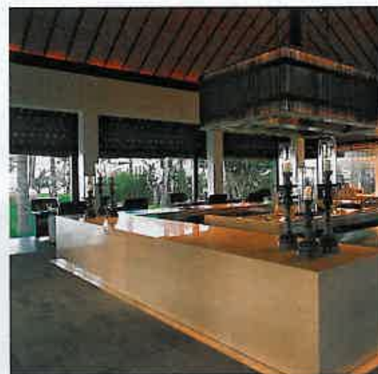
Il bar del resort The Nam Hai in Vietnam, della catena Ghm.

Dhabi e in Qatar. Ma riservatevi di vedere il luogo più incontaminato, incantato e carico di storia per ultimo». Come tenersi la ciliegina della torta per ultima... «Esatto. Siamo consapevoli del tesoro che abbiamo: il nostro deserto; le nostre montagne che corrono da nord lungo la costa per tuffarsi nel mare una volta a Muscat; e la barriera corallina».