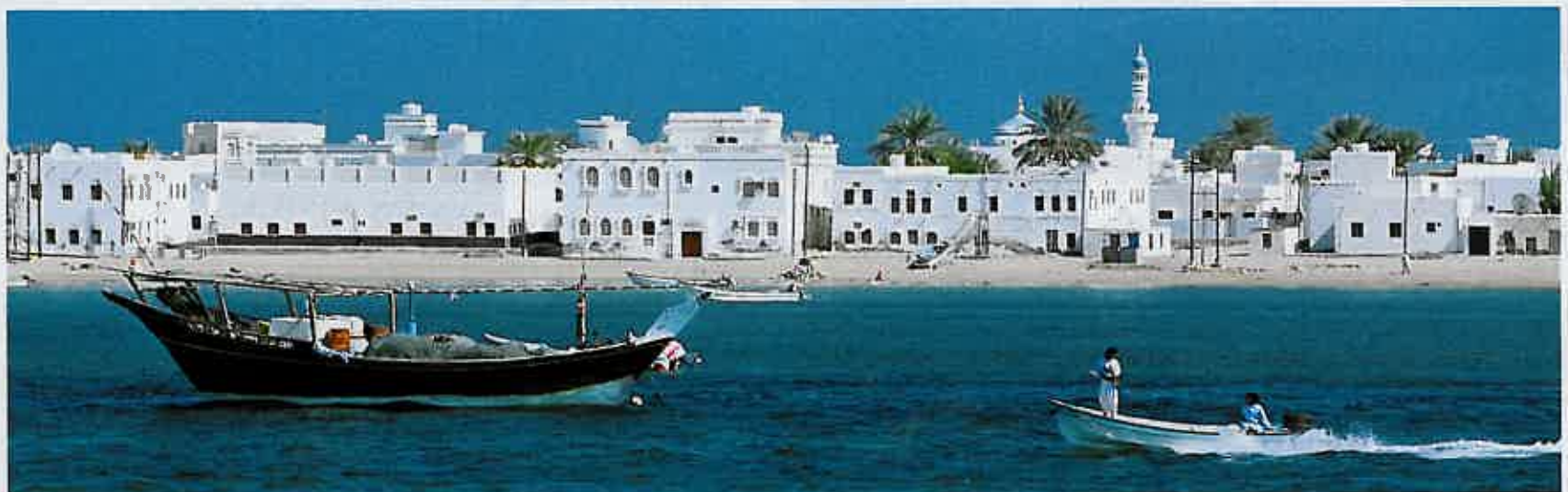
La cittadina portuale di Al-Aija vista dal mare.