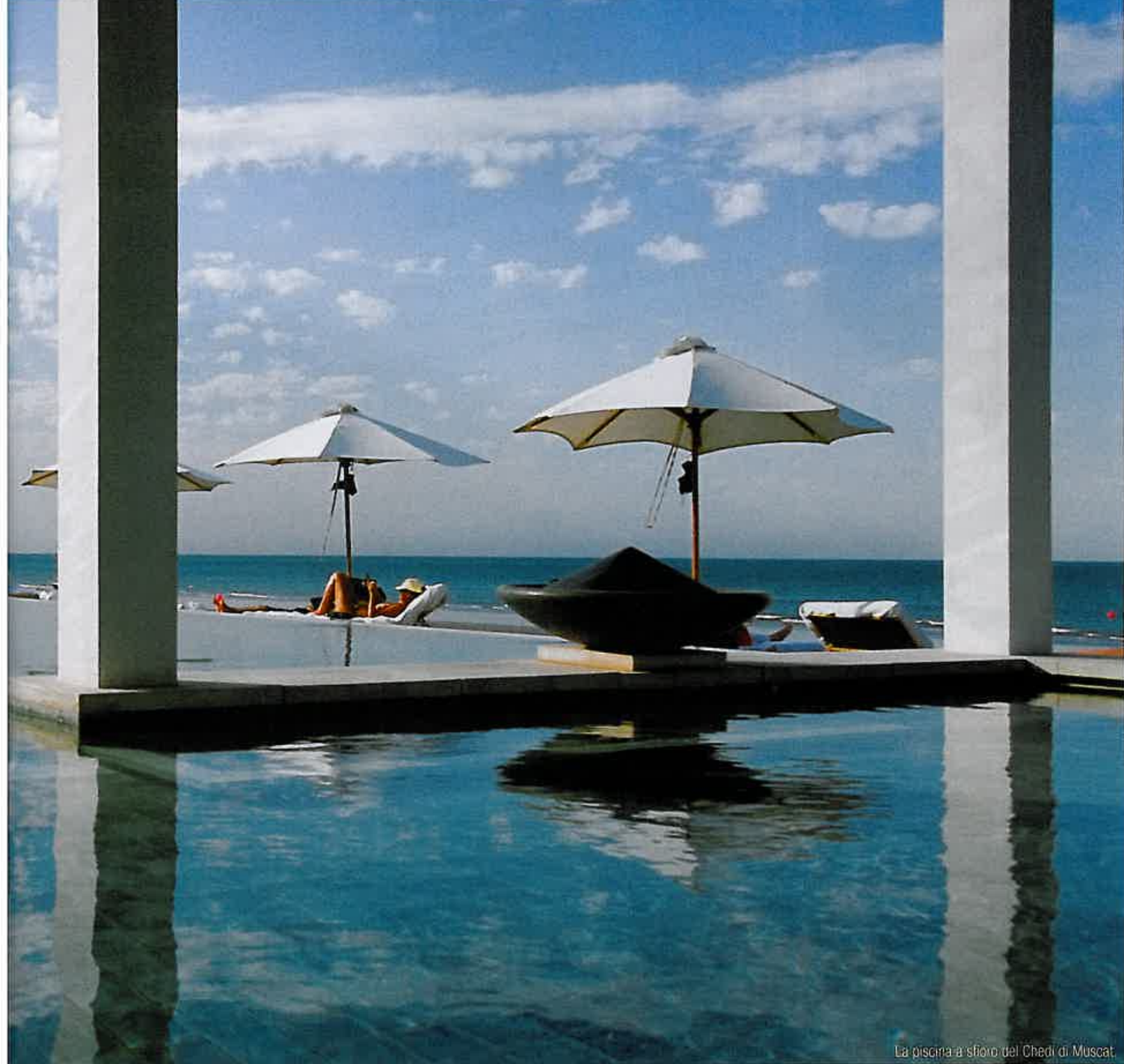
La piscina a sfioro del Chedi di Muscat